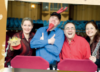
Kindertheater des Monats NRW im Sommer 2007