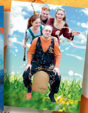
Vom Warm-Up der Sinne bis zum Rate-Rap