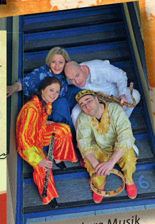
Elementare Musik für die ganze Familie