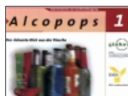
Flyer zu Alcopops bei ginko zu beziehen

Quelle: Bekanntheit, Kauf und Konsum von Alcopops in der Bundesrepublik Deutschland 2003 – Ergebnisse einer repräsentativen Befragung. BZgA 2003